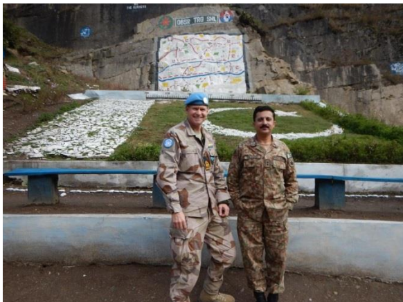
Tillsammans med brigadens artillerichef