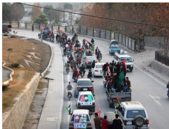
Sejerpårad efter lokalt val i Muzaffarabad

En deluppgift är att informera om vårt uppdrag och då passar det bra med att besöka skolor. Jag fick en fråga vad jag tycker om att flickorna har täckta ansikten. Nämnde inget om jämställdhet och mänskliga rättigheter utan uttryckte om förståelse för kultur och religion. Men vad skulle jag säga i det läget.