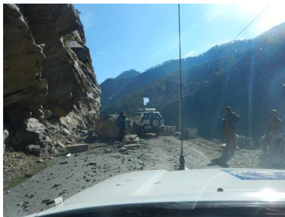
Dagen efter passerade vi 67 skred

På väg till en uppgift passerade vi flera jordskred. Vid ett ställe tog det stopp. Sekunderna efter bilden togs rasade mer. Jag varnade min Koreanska chef att vi skulle backa men han envisades med att vi skulle fram. Han fick ge upp tillslut.