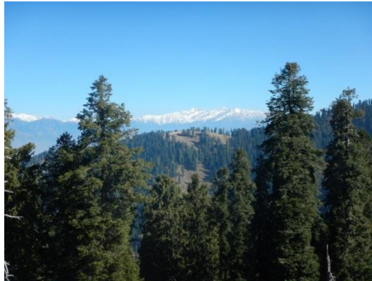
2000möh fantastiskt vackert

Det är allt för denna gång Fler bilder finns på Facebook.