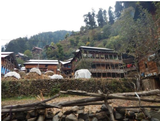
Bebyggelse i längs Neelum

20-21 oktober åkte teamet ca 15 mil norrut längs floden Neelum till en plats som heter Kel. Resan kändes som att åka bakåt i tiden och det var mycket primitivt. Temperaturen sjönk från ca 25° till 10° under några timmar bilfärd. Vi inkvarterade på en pakistansk armébas. Tror vi bodde i gästrum avsett för överstar och generaler, det var fint men kallt. Det ställdes fram en gasolvärmare. Middagen intogs i mörker, då elen var borta samt att vi fick klä oss ordentligt. Min koreanska och filippinska kollega frös ordentlig. På natten fick vi ta fram våra sovsäckar. Dagen efter åkte vi vidare längs floden, tyvärr var vägen i dåligt skick så vi kunde inte ta oss ända fram till avsett resmål.