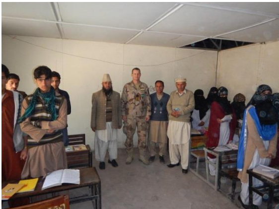
Besök på en skola

När jag kom tillbaka återvände jag till FS Domel och har tjänstgjort som stationschef. Inget märkvärdigt i sig men man har ansvar för en ganska omfattande administration.