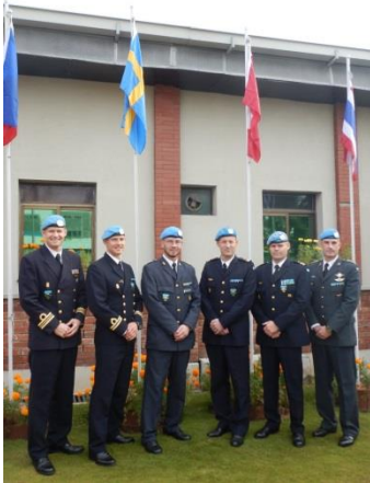
Svenska kontingenten (Ur flottan, amfibiekåren, artilleriet, flygvapnet och kavalleriet).

Efter konferensen åkte jag hem på två veckors ledighet. Det var intensiva dagar som passerade alldeles för snabbt.